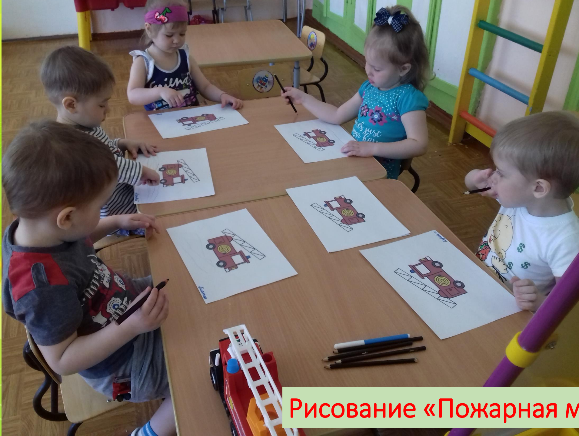
Рисование «Пожарная машина»